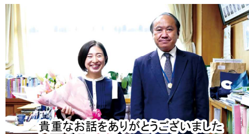
貴重なお話をありがとうございました