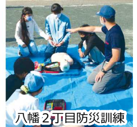
八幡2丁目防災訓練

また、2つの町内会で独自の防災訓練を実施し、発災時、町内の自主防災組織が住民の安否確認やけが人の救出などができるか、現状を見直す機会になりました。