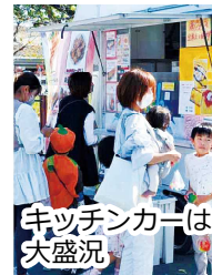
キッチンカーは大盛況