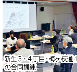
新生3・4丁目・梅ヶ枝通1の合同訓練

神山連区防災訓練は各町内の町会長、防災委員に参加をお願いして実施しました。講演「マイタイムラインの作り方」では風水害などの災害が迫る状況で、いつ何をすべきか行動計画を考えることの重要性を学び、凝固剤使用法、心肺蘇生・AED、ロープワーク訓練で災害に備えた実習を行いました。