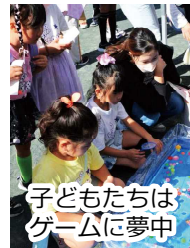
子どもたちはゲームに夢中

神山納涼夏まつりを新型コロナウイルスの感染拡大によりやむなく中止してから2か月、連区の役員の皆様また多くの方々のご協力のもと「一宮市 100 周年 +1 かみやま祭」を開催することができました。