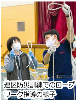
連区防災訓練でのロープワーク指導の様子

神山連区防災訓練は各町内の町会長、防災委員に参加をお願いして実施しました。講演「マイタイムラインの作り方」では風水害などの災害が迫る状況で、いつ何をすべきか行動計画を考えることの重要性を学び、凝固剤使用法、心肺蘇生・AED、ロープワーク訓練で災害に備えた実習を行いました。