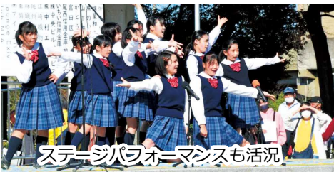
ステージパフォーマンスも活況

当日は好天に恵まれ非常に多くの方々にご来場いただき、各コーナー大盛況のうちに終了することができました。今後も連区の皆様のご意見を頂きながら、ウィズコロナにおけるより良いイベントを目指して参りますので宜しくお願いします。