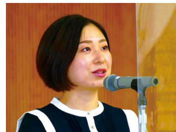
「夢」をあきらめないで…