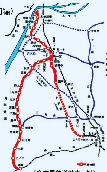
『名古屋鉄道社』より

【現在の乗降客数】 乗車総数：6380467人(定期利用者 4457610人) 出所：令和3年度 愛知県統計年鑑 / 1日平均＝17706人、1日約460本の運行、運賃：名鉄名古屋まで、約15分・380円 / <<名鉄乗車人員数駅順位>> ①名鉄名古屋 ②金山③栄町④東岡崎⑤豊田市⑥名鉄一宮