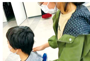
先生に教わって ⇒ みんなで練習して ⇒ 気持ちいいですか?