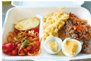
先生に教わって ⇒ 料理して ⇒ ランチボックス完成です

第8回は、「マッサージにチャレンジ」神山連区内で開業されている尾関治療院尾関先生指導のもと、家でも行える肩たたきを教えていただきました。たたく前に、肩、手首のストレッチが必要だと説明あり。4つの打法を丁寧に習って、自分の太ももやお腹をたたいてみる。なかなか難しい。帰宅してご両親や祖父母にやってあげるのかな!?