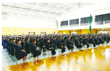
真剣に話を聴く生徒たち