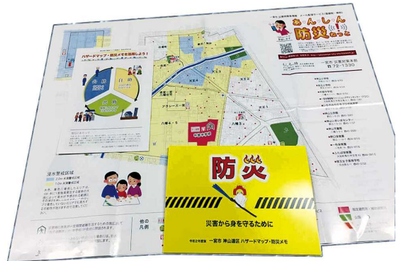
令和2年度に神山連区で全戸配布された防災ハザードマップ・防災メモ