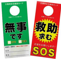
令和3年度に神山連区で全戸配布された災害時安否確認カード

防災、減災は発災後の被害をできるだけ小さくするため「日頃からの備え」が重要です。南海トラフ巨大地震に襲われると電気・ガス・水道などのライフラインが長期間停止し、日常生活ができなくなります。