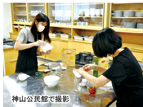
神山公民館で撮影