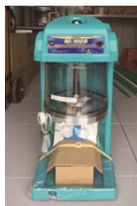
← 電導かき氷機 ↓ 長期保存水おりひめ