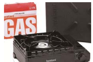
↑ カセットガスとコンロ ↓ 使い捨てマスク