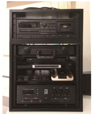
↑ カラオケセット ↓ 大型カマド

何よりも地域づくり協議会メンバーのほか大勢の方の知恵と尽力の賜物であり関係各位に感謝申し上げます。