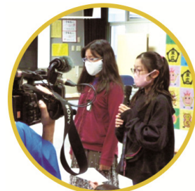
前期・後期児童会長 誓いのことば

末広小学校は、今年度創立50年の節目の年を迎えました。当初は、ご来賓や地域の方を招いての式典を行う予定でしたが、コロナ禍の関係で内容を変更し、11月5日(木)に「末広小学校創立50年を祝う会」という形で開催しました。