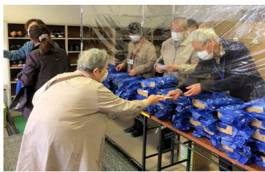
神山小学校アリーナで撮影

今年は新型コロナウイルス感染防止のため、土日の2日間対応とし、従来の式典およびアトラクション等は中止、記念品のみ引渡しになりました。