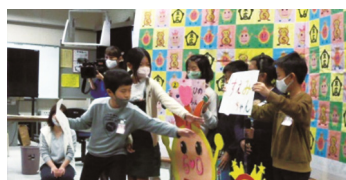
児童会によるクイズ

この日のために、児童会の子どもたちと教員を中心に、会の内容を考え、当日は、末広小学校にまつわるクイズや50年の歴史を振り返る写真画像などを披露しました。ZOOMを使用し、各教室で映像を見ながら全校児童が会に参加しました。