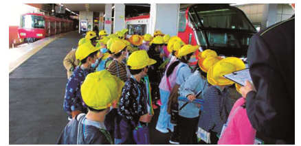
2年生 名鉄一宮駅見学