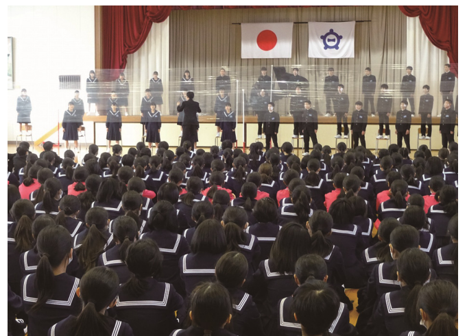
3年生の合唱を聴く1年生、2年生