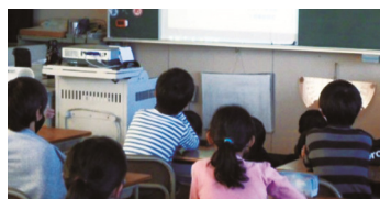
Zoomで教室から会に参加

この日のために、児童会の子どもたちと教員を中心に、会の内容を考え、当日は、末広小学校にまつわるクイズや50年の歴史を振り返る写真画像などを披露しました。ZOOMを使用し、各教室で映像を見ながら全校児童が会に参加しました。