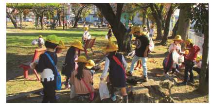
1年生 富古場公園「秋みつけ」

コロナ禍の今だからこそ、ソーシャルディスタンスを取りながらも、仲間とともに心を寄せ合い、一致団結して活動する喜びとその大切さを、子どもたち自身が感じることができたようです。支えていただいたすべての方々に、この場をお借りして感謝申し上げます。神山の子が『笑顔いっぱい 元気いっぱい 学びいっぱい』になるように、今後の教育活動を工夫して進めていきたいと思えます。