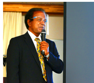
神山公民館で撮影

教育者の方も工夫が必要。子どもたちの実践力がつきやすい環境づくりが求められているのではないかというお話でした。