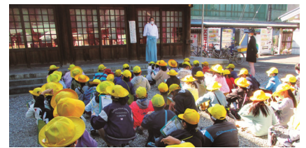
4年生 真清田神社見学