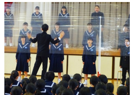
ダイナミックな指揮

2年生、1年生は、自分たちの力で合唱を創り上げるという中部中の伝統のタスキをしっかりと受け継ぎ、さらに素晴らしい合唱に発展させていってくれるものと期待をしています。