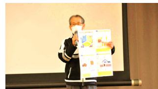
各写真は神山小学校アリーナで撮影