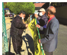
久古見公園(新生2)で撮影