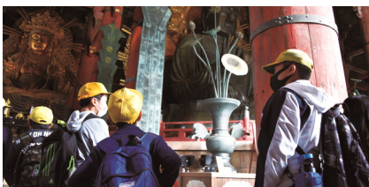
6年生 修学旅行（東大寺）