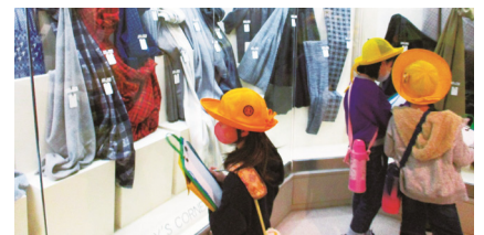
3年生 ファッションデザインセンター見学