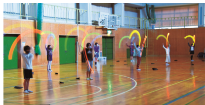
5年生 キャンプ（室内でのトワリング）