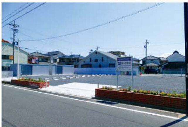
第6駐車場 (旧神山公民館跡地)

そして、旧神山公民館跡地には、待望の倉庫が2棟設置されました(左下写真の左側)。公民館推進事業倉庫として、地域づくり活性化のために、防災・減災の備えとして多方面で活用される予定です。