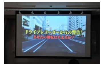
神山公民館で撮影

街中を運転している様子をドライブレコーダーで記録し、左折時の巻き込み事故、右折時の右直事故、繁華街で路上駐車に向こうから飛び出してくる子どもなど、それぞれの場面でどのような運転をし何が注意不足だったかを振り返るDVD鑑賞を行いました。