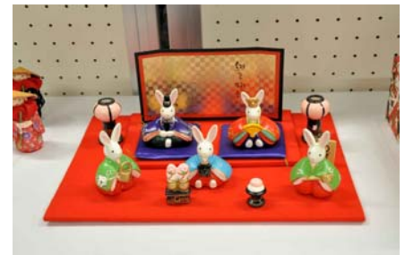
神山公民館で撮影

また、小中学校、修文女子高校のクラブ作品も多数展示され、本人、お友達、ご家族の方も多数観覧にいられていました。