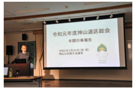
神山公民館で撮影

なお、この様子は初の試みとして神山連区地域づくり協議会ホームページでライブ配信し、会場に来られなかった方にもご覧いただけるようにしました。