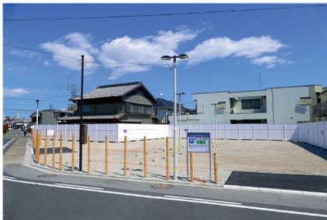
第5駐車場 (旧神山としよりの家跡地)

令和元年9月に使用停止になった旧神山公民館と、旧としよりの家の跡地に、いちのみや中央プラザ駐車場(第5駐車場と第6駐車場)が整備されました。旧神山公民館跡地には、南北に41台駐車可能なスペースが確保されました。旧神山としよりの家跡地は、地盤が安定するまで1～2年間は未舗装期間を設けることとなりました。一宮駅からも近く、交通の便がよい立地条件に恵まれて、さらに利用の拡充が期待されています。