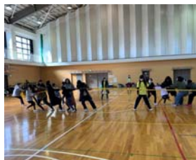
神山小学校で撮影

父兄、児童、役員合わせて200名の参加がありました。無作為にチーム編成を行い各チーム17~18名10組に分かれてジャンケンゲーム、綱引き、室内ペタンクを行いました。当初、静かなスタートで始まりましたが次第に大きな声援を送ったり楽しいゲーム大会となりました。