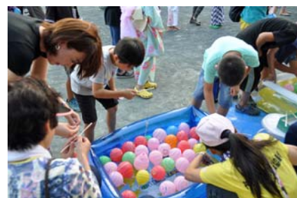
写真は8月5日、6日 稲荷公園で撮影