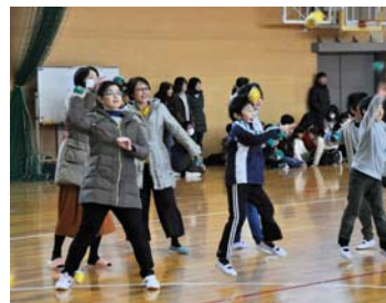
神山小学校アリーナで撮影

平成30年度に4年生・5年生になる児童と新指導者が参加して、みんなでゲームを通じてルールを学ぶことを目的にしたゲーム研修会を行いました。昨年までと内容を一新し、どのゲームもみんな大きな声が出ていました。