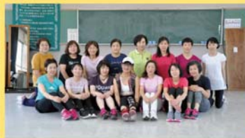
練習風景と集合写真