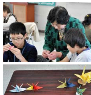
神山公民館で撮影

「連鶴の会」より3名の先生に、小学生、保護者、連区関係者約30名に親子鶴と妹背山の2種類の連鶴の折り方を教えていただきました。先生やお母さんが子どもの手を取りいっしょに折鶴を行っている楽しくて微笑ましい時間が流れました。