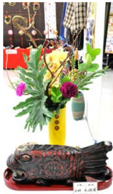
神山公民館で撮影

神山公民館を利用して作品作りを行っているクラブや、活動を行っている各種団体が、1年間の成果を発表・展示しました。2月16日は253名、2月17日は310名もの多数のご来場があり、素晴らしい作品に見入っていました。お抹茶は両日、ぜんざいは2月17日に振舞われました。