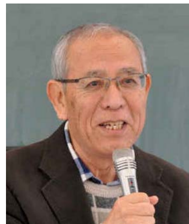
鎌倉連区長・地域づくり協議会会長