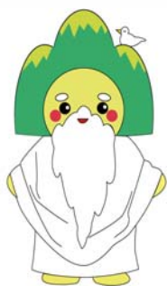
神山連区マスコット かんなびさん