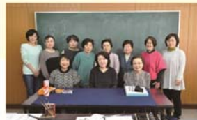
練習の様子 / 集合写真